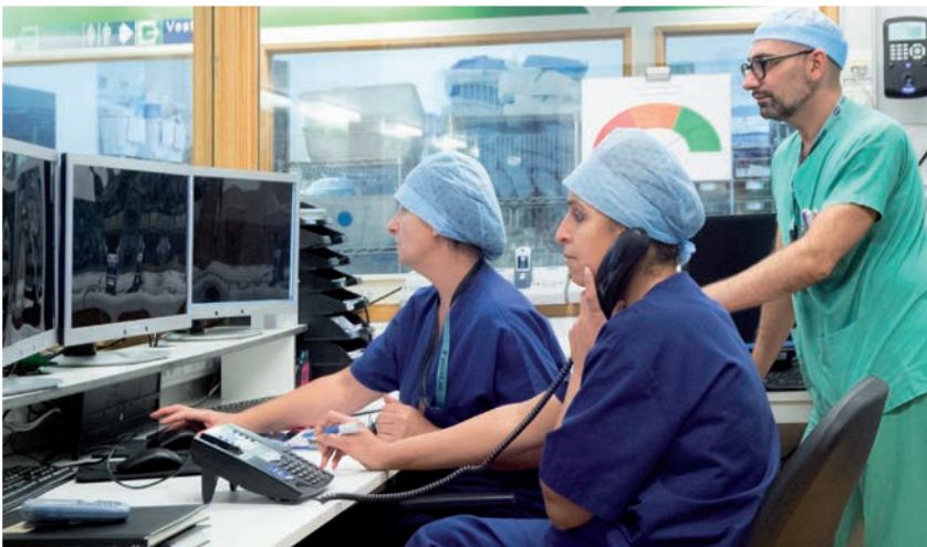
La qualité et la sécurité des soins se jouent aussi dans les coulisses. Ici, dans le cockpit du Quartier opératoire, où l'on veille au fonctionnement optimal du bloc.

Concrètement, des auditeurs ACI ont évalué les pratiques des Cliniques lors d'une visite d'accréditation en février dernier. Ils ont pris en compte plusieurs dimensions: accessibilité, services et soins axés sur le patient, continuité des services et prévention des risques, efficacité, dimension sociale, qualité des soins, sécurité, qualité de vie professionnelle.