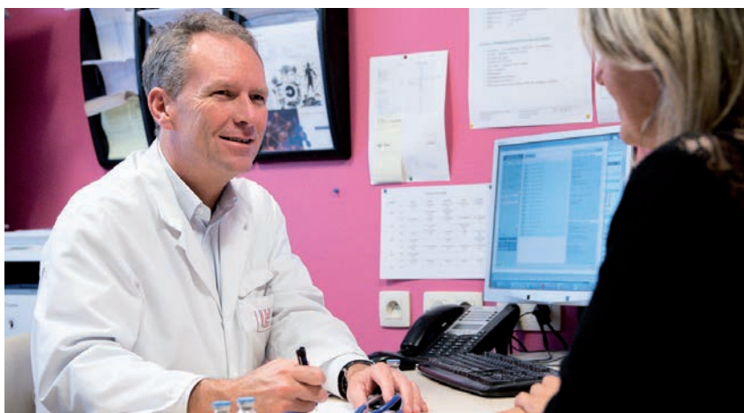
■ L'objectif des études sur la thérapie génique est de donner la possibilité au foie de produire, par lui-même, les protéines manquantes.

Les premiers résultats devraient être observés quelques semaines après la première injection. A ce jour, près d'une trentaine de patients atteints d'hémophilie ont été guéris dans le monde grâce au traitement.