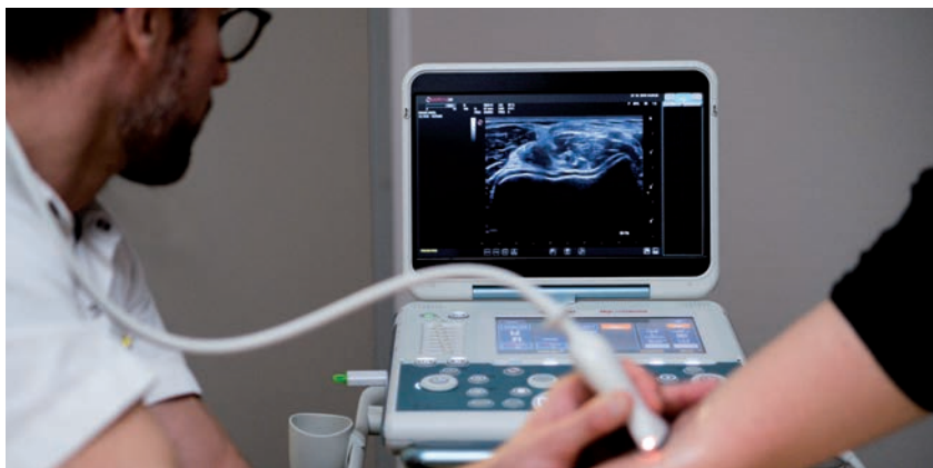
■ L'hémophilie entraîne des hémorragies spontanées dans les articulations et dans les muscles.

Pour moi, il est important de boucler la boucle. On a démarré de rien, à une époque où l'hémophilie était à peine connue. Et on en arrive à une potentielle guérison ou, en tout cas, à une thérapie qui nous permettrait de ne plus devoir nous injecter et de ne plus saigner spontanément. C'est une grande aventure. »