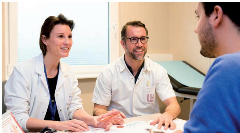
Des études sont menées dans le Service d'hématologie de Saint-Luc sur la thérapie génique, un traitement qui pourrait guérir l'hémophilie en Belgique.